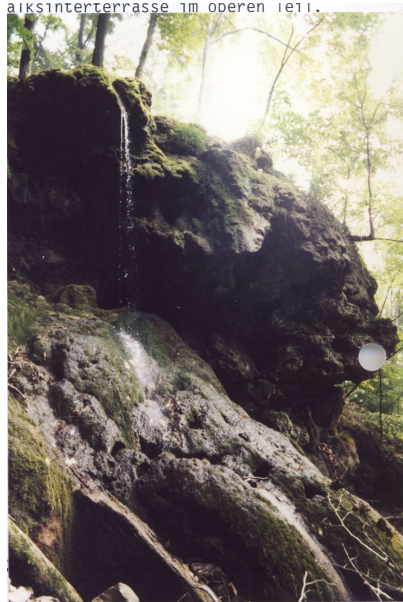
als Bereich unterhalb der Quelle